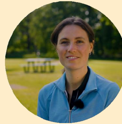
Träningen och tävlingarna