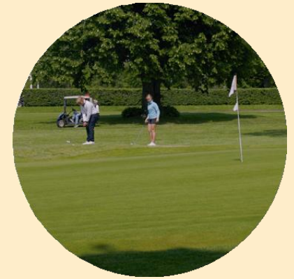
Partnerskapen och vår roll i samhället