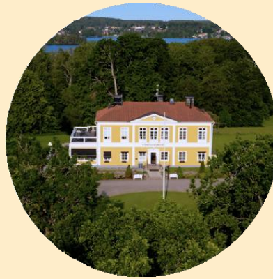
Klubbkulturen och kommunikationen