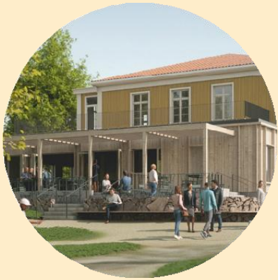
Golfbanan och anläggningen