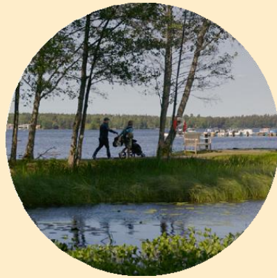
Service och upplevelserna